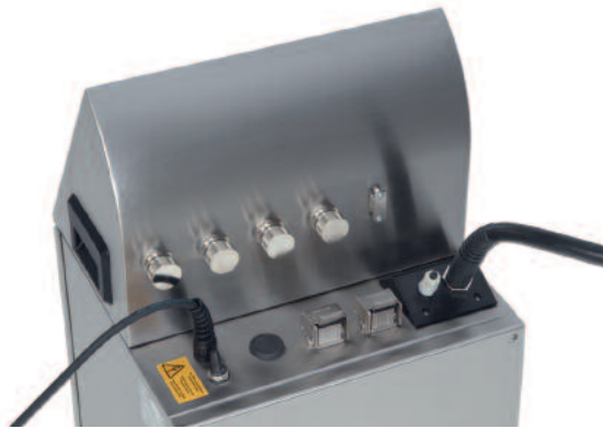
Rückansicht mit Anschlüssen

Der alphaJET into überzeugt durch seine Wirtschaftlichkeit, hohe Druckqualität bei höchsten Produktionsgeschwindigkeiten, geringen Wartungsaufwand und einfachste Bedienung. Damit ist der alphaJET into das Kennzeichnungssystem für alle, die Wert auf hohe Zuverlässigkeit, niedrige Kosten und umweltverträgliche Prozesse legen.