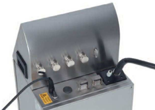
Rückansicht mit Anschlüssen