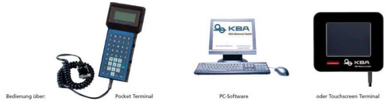
Bedienung über: Pocket Terminal PC-Software oder Touchscreen Terminal

PC-Software, Pocket Terminal, Touchscreen Terminal, einfache Texterstellung über PC-Software mit Windows-Oberfläche (XP, Win7, Win8, Win10), WYSIWYG Anzeige, frei wählbare Zeichengröße, verschiedene Datum- und Zeitformate, laufende Nummerierung oder Textanpassung, Barcodes, 2D-Codes, Datenbankdruck, Logos oder Grafiken, zuladbar im IMG- oder DXF-Format, True Type Fonts, Unicode, MFF, Crystal Fonts 7 x 5, 5 x 5, variable Schreibgeschwindigkeit, intermittierende und kontinuierliche Beschriftung